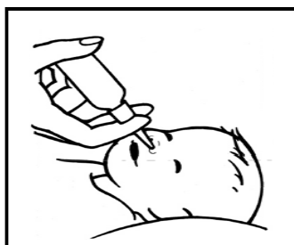
Podanie dawki dziecku w pozycji leżącej